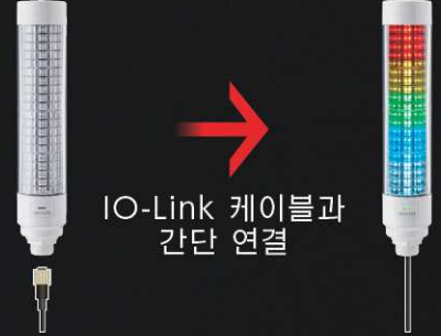
IO-Link 케이블과 간단 연결