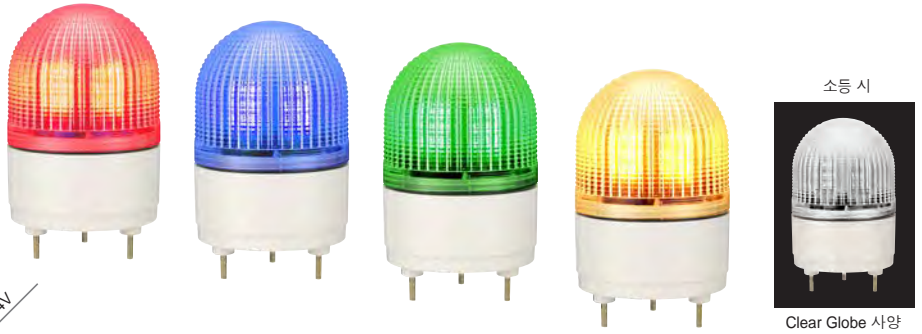
소등 시 Clear Globe 사양

점멸 · 유동 · Strobe의 3가지 발광 Pattern을 외부 접점을 통해 제어할 수 있는 LED 표시등